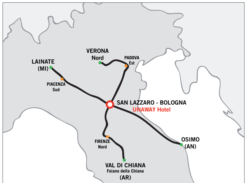
Percorsi Pullman gratuito 3D Industry